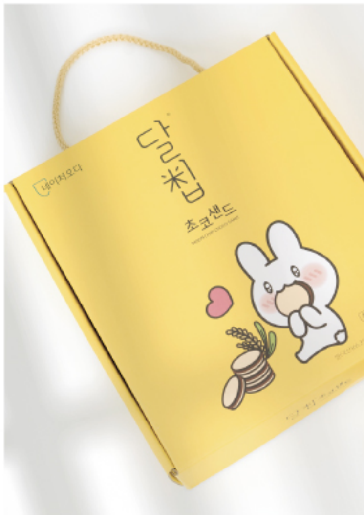
20개입 선물세트 판매 220 * 258 * 48 mm