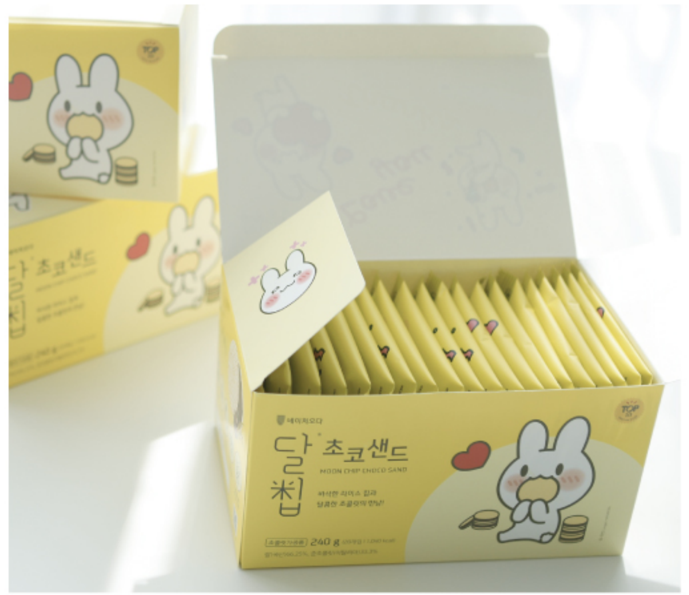
20개입 일반 판매 195 * 120 * 105 mm