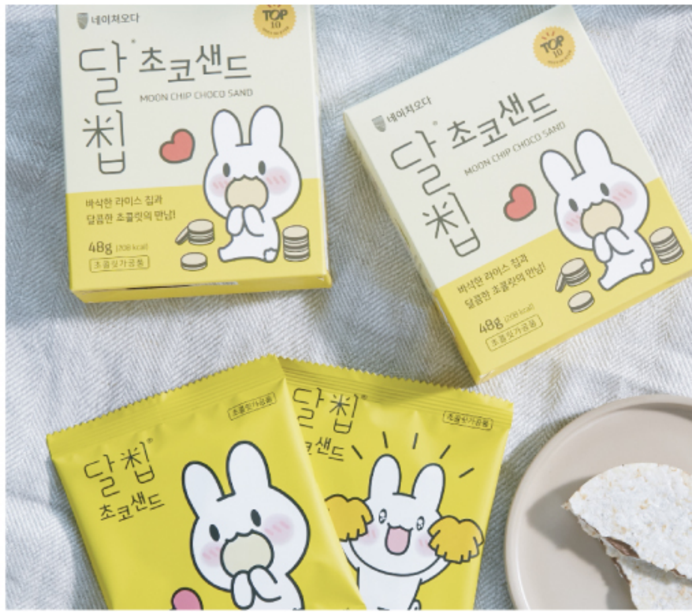
4개입 일반 판매 102 * 40 * 120 mm